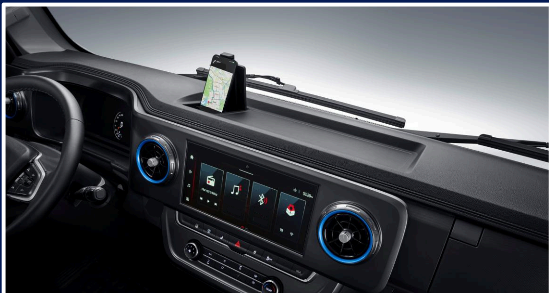
Central multimídia de 10,25”