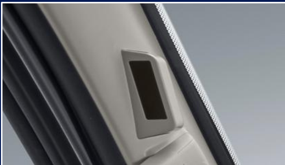
Sistema de monitoramento de fadiga